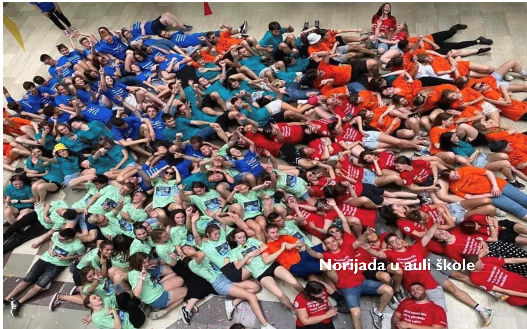
Norijada u auli škole