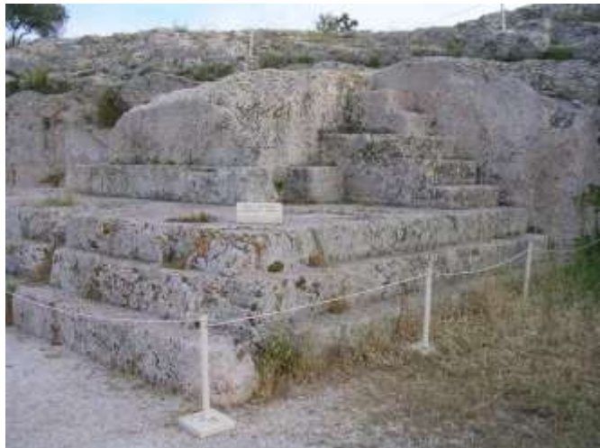
Slika 6: Brdo Pnyx, na kojem je zasjedala Atenska Skupština. U središnjem planu je mjesto govornika u Skupštini. Na ovom mjestu su se okupljali svi građani Atene otprilike tri puta mjesečno. Ovdje bi debatirali oko važnih stvari i glasali za određene zakone. Jednom godišnje glasali bi o protjerivanju nekoga iz Atene ( ostrakizam ). Na drugoj strani Atene, ispod Agore, na mjestu koje se naziva Bouleuterion sastajalo se Vijeće 500 ili Boule . To Vijeće rješavalo je svakodnevne političke i ekonomske stvari u Ateni, i određivalo dnevni red za Skupštinu, a članovi (koji su birani ždrijebom), spavali su u obližnjem Tholosu kako bi bili spremni brzo reagirati u slučaju potrebe.