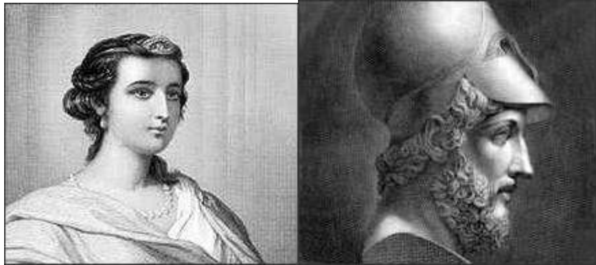
Slika 5: Periklo i njegova žena i pratiteljica Aspazija. Periklo je bio jedan od najznačajnijih ljudi u stvaranju atenske demokracije i njezinih kulturnih i civilizacijskih vrijednosti. Krug njegovih prijatelja i suradnika bila su „strašna“ imena, koja još danas izazivaju strahopoštovanje – dramatičar Sofoklo ; povjesničar Herodot ; kipar i umjetnik Fidija ; filozof-sofist Protagora . Njegova žena Aspazija također nije bila obična ženica, već bivša kurtizana, vrlo lijepa, obrazovana i utjecajna.

Osim demokratskih uvjerenja, Periklu je dobrobit i zadovoljstvo siromašnijih slojeva bilo važno i iz dodatnih razloga, naime temelj atenske vojne moći bila je mornarica, a veslači na brodovima regrutirali su se iz najsiromašnijih slojeva. Time su oni podržavali Perikla u jedinoj izbornoj dužnosti u Ateni, a to je bio položaj stratega (general). Svake godine se biralo 10 vojnih zapovjednika, a Periklo je bio izabran 15 godina za redom.