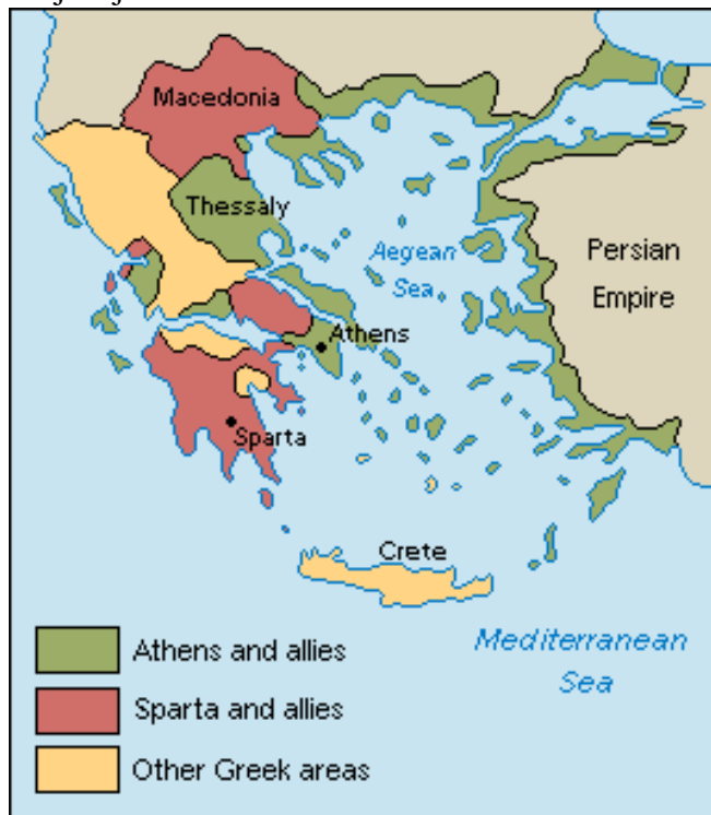
Slika 4: Mapa na kojoj je prikaz podijeljenosti Grka na one koji su u savezništvu s Atenom, odnosno Spartom.

ratovanja Atena je dobro iskoristila svoju vojničku komandu koja joj je dodijeljena od članica Delske lige, pa je počela širiti i svoj politički utjecaj, tj. počela se miješati u unutrašnje stvari mnogih polisa koji su bili članovi Lige. Atena je uspjela pridobiti ostale članove da se blagajna sa otoka Delosa prebaci u Atenu, što je omogućilo bogaćenje Atene, a Delska liga postaje u stvari Atenski pomorski savez ili mala atenska imperija. Sa političkim vodstvom ubrzo je