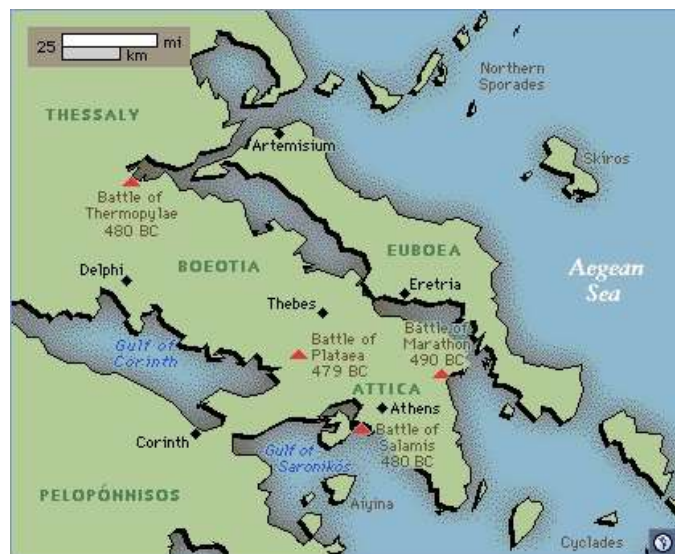
Slika 1: Mapa s lokacijama najznačajnijih bitaka u Grčko-perzijskim ratovima

U isto vrijeme u Ateni su se dogodile dvije značajne stvari – vodeći politički strateg postaje Temistoklo , a u atičkim rudnicima srebra ( Laurium ) pronađena je nova vrlo bogata srebrna žila . Temistoklo je uspio uvjeriti Atenjane da se srebro uloži u izgradnju ratne mornarice, tj. gradnju oko 100 trirema, jer će prema njegovom mišljenju pomorska snaga biti