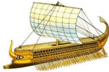
Slika 3: Grčka trirema s kakvom su Grci pobijedili u bitki kod Salamine, 480. B.C.

Salaminu, a Perzijanci su razorili nebranjenu Atenu. Temistoklo je tada poslao slugu kralju Kserksu sa lažnom porukom da napadne odmah ako želi spriječiti da demoralizirano stanovništvo pobjegne. Na taj je način Temistoklo navukao perzijsku mornaricu na bitku u uskom prolazu između otoka Salamine i luke Pirej (bitka kod Salamine 480.g.B.C.), gdje su manji i pokretljiviji grčki brodovi bili u velikoj prednosti, a spretnom taktikom Grci su se prebacivali na perzijske brodove gdje su se mogli boriti kao na kopnu. Salamina je bila jedna od važnijih bitaka u povijesti, jer porazom u njoj Grčka bi postala jedna od perzijskih satrapija i tko zna kako bi se to odrazilo na grčku umjetnost, dramu, filozofiju, povijesnu znanost i demokraciju, ali grčka pobjeda uvjetovala je odlazak Kserksa i njegove mornarice i to je bio zadnji posjet perzijskog kralja Europi.