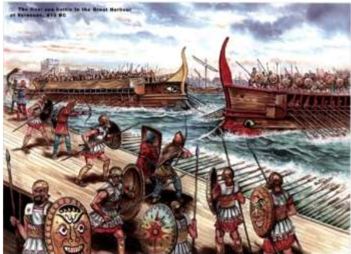
Slika 8: Katastrofa atenske mornarice na Siciliji. Poraženi članovi atenske mornarice završili su kao zarobljenici i radili mukotrpno na sicilskim kamenolomima sve do smrti od iznemoglosti.

Alkibijad , talentirani mladi političar, vrlo ambiciozan uspio je uvjeriti atensku skupštinu da odobri slanje velike flote na Siciliju , kako bi se pomoglo tamošnjim jonskim polisima (prije svega Segesti ) i spriječilo Sirakuzu ( polis Dorana ) koja je na strani Sparte, u daljnjoj opskrbi Sparte žitom i drvetom. U stvari Alkibijad je imao namjeru osvojiti cijelu Siciliju , a zatim i Kartagu i tako za Atenu osvojiti nove oblasti na Zapadu u kojima bi on bio glavna ličnost. Uoči polaska ekspedicije netko je u Ateni porazbijao herme (stupovi sa glavom boga Hermesa ), pa su zagovornici miroljubive politike za taj čin optužili Alkibijada, kojem je naređeno da se vrati u Atenu i pristupi suđenju kojim bi se dokazalo da li je kriv ili nevin. Alkibijad je strahovao da će mu politički neprijatelji