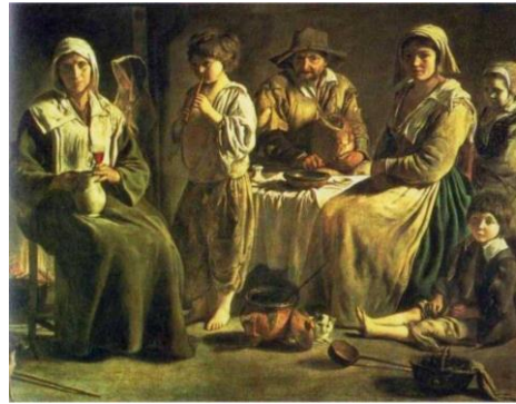
Slika 1: Siromašno seljaštvo u Francuskoj u predvečerje Revolucije bilo je suočeno s gladi i bijedom, jer zbog sve lošijih žetvi cijene hrane skočile su jako visoko. Zahtjevi za kruhom bili su sve jači.

Dvije godine prije početka Francuske revolucije, britanski putopisac Arthur Young opisao je u svom tekstu o putovanju kroz Francusku "veliko vrenje među svim ljudima u Francuskoj, koji su željni nekih promjena, a i da sami nisu svjesni kakvih." Ljudi s kojima je Arthur Young razgovarao u Parizu zaključili su "da je stigao u samo predvečerje neke velike promjene u vlasti." Young je prepoznao nezadovoljstvo društva s Francuzima, ali postojao je dobar razlog za pretpostavku da će, bez obzira na nezadovoljstvo, kriza proći bez fundamentalnih promjena u monarhijskom sistemu ili društvenom poretku. Nezadovoljstvo naroda u Francuskoj bilo je dosta česta pojava, tako da raspoloženje naroda nije zabrinjavalo francusku društvenu elitu. Doduše, bili su svjesni da se Francuska nalazi u priličnoj financijskoj krizi, ali mislili su da će nova financijska reforma riješiti nagomilane probleme, što će umiriti i nezadovoljstvo ljudi. Ono čega francusko plemstvo ipak nije bilo svjesno jest činjenica da nema rješenja financijskih problema ako se ne dira u njihove povlastice, odnosno ako se ne promijeni sistem oporezivanja, u kojem bi i plemstvo i svećenstvo, kao najbogatiji sloj društva, sudjelovalo u plaćanju poreza. Do ljeta 1789. gladna, slabo plaćena i nezaposlena masa