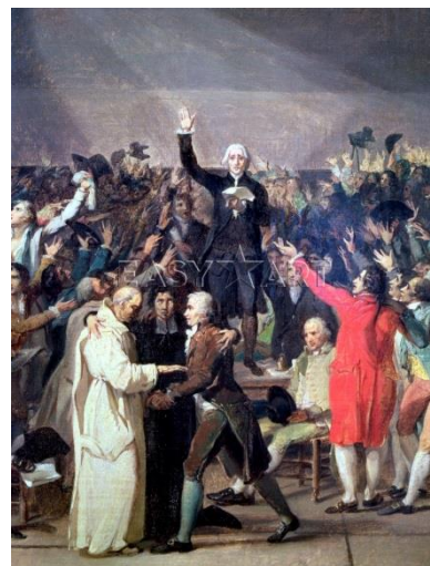
Slika 8: Djelo Jacquesa-Louisa Davida Zakletva na teniskom terenu . U središtu je Jean-Sylvain Bailly (koji će uskoro postati gradonačelnik Pariza), predsjedavajući skupštine, u trenutku kada na glas čita tekst zakletve. Ispred njega su karakteristični predstavnici sva tri staleža i francuskih religijskih skupina, pa sve djeluje vrlo demokratski. Neposredno prije ovog događaja, kralj je poslao svog ceremonijal meštra, Dreux Brézéa da raspusti Skupštinu, ali mu je grof Honore de Mirabeau odgovorio: „Kažite svome gospodaru, da smo ovdje po nalogu naroda i da ćemo uzmaknuti samo pred silom bajuneta!“

Organiziranje Narodne skupštine Više od mjesec dana trajala je ovakva pat situacija, pa se treći stalež odlučio na radikalni potez, proglasili su se Narodnom skupštinom i pozvali ostale staleže da im se pridruže. Nakon nekoliko dana, kada su trebali održati svoj prvi sastanak, njihova dvorana bila je zaključana. Otišli su na obližnje zatvoreno tenisko igralište, gdje im se pridružio i znatan broj predstavnika prva dva staleža. Na teniskom igralištu zavjetovali su se da se neće razići dok Francuskoj ne podare ustav . Nekoliko dana poslije, kada je kralj shvatio da se oni zaista ne žele razići (navodno je rekao: "k vragu, pa neka onda ostanu.") odlučio je da će staleži sastančiti zajedno i glasati pojedinačno. Treći stalež je dobio prvu rundu.