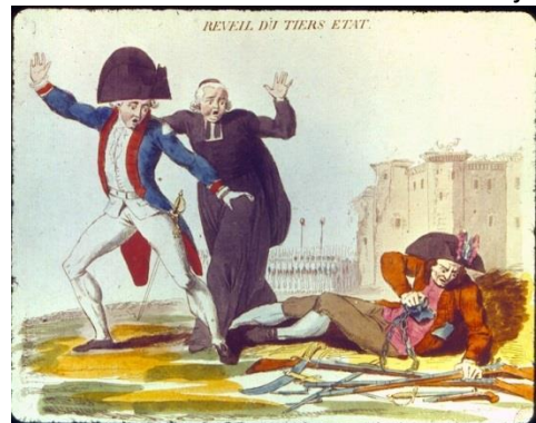
Slika 2: Buđenje Trećeg staleža. Karikatura predstavlja društveni poredak ancien régimea pred Revoluciju. Ogorčeni predstavnik Trećeg staleža počinje izražavati svoj bijes i ustaje, dok plemić, koji predstavlja Drugi stalež i svećenik, koji predstavlja Prvi stalež, u panici i strahu polako uzmiču.

Svećenstvo i Crkva Tijekom Srednjeg vijeka Crkva je preuzela veliki dio utjecaja u društvenom i političkom životu kršćanske Europe. U Francuskoj, u predvečerje Revolucije, Crkva još uvijek uživa veliki utjecaj i posjeduje ogromno bogatstvo. Crkva posjeduje oko 10% zemljišnih posjeda u Francuskoj, dobiva i dalje desetinu od seljaka, a ne plaća nikakav direktan porez državi . Unatoč golemom bogatstvu Crkve, u njenim redovima bilo je priličnih razlika. Visoki crkveni dužnosnici, npr. biskupi najčešće su birani iz redova plemstva i živjeli su raskošnim životom, dok su istovremeno obični župnici, skromnog podrijetla živjeli siromašno kao i njihovi župljani.