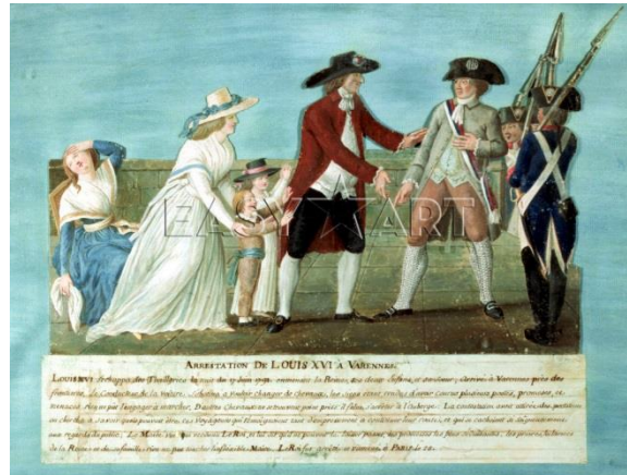
Slika 14: Hapšenje Louisa XVI i njegove obitelji u selu Varennesu, u blizini granice. Cijela obitelj pokušala je pobjeći uz pomoć navodnog ljubavnika Marie Antoinette, švedskog časnika Hansa Axela von Fersen. Kralj je bio prerušen u slugu, kraljica u guvernantu, a u kočiji su još bila njihova djeca. Sasvim slučajno je prerušenog kralja prepoznao krčmar, kojeg je iznenadila sličnost čovjeka u gostionici i kraljeve slike na jednom asignatu.

Kraljev pokušaj bijega Dok se Francuska preslagivala, a Narodna skupština donosila nove zakone koji su modernizirali zemlju, kralj je to mogao samo nijemo promatrati iz svog kućnog pritvora. Na nagovor kraljice, Louis XVI odlučio se na bijeg iz zemlje. Nadali su se da bi uz pomoć kraljičinog brata, cara Leopolda II i austrijskih snaga možda mogli promijeniti tijek događaja. Jedne noći u lipnju 1791. kola s kraljem, kraljicom i kraljevskom djecom krenula su prema granici. Plan je propao nadomak granice, kada je krčmar prepoznao kralja prema slici na novčanici. Svi su, pod vojnom pratnjom, vraćeni u Pariz, gdje ih je dočekalo bijesno mnoštvo optužujući ih za izdaju naroda i Revolucije.