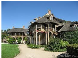
Slika 5: Seoska kućica za zabavu Marie Antoinette.

Golemi nacionalni dug Kada je Louis XVI 1774.g. sjeo na prijestolje, naslijedio je i veliki, stalno rastući nacionalni dug . Najveći dio duga nastao je još u vrijeme Louisa XIV, a financiranje skupih ratova, kao što su bili Sedmogodišnji rat i Američka Revolucija , te održavanje goleme vojske, samo su taj dug povećavali. Ne treba zaboraviti da raskošni Versailles guta nebrojene milijune. Da bi premostila razliku između prihoda i rashoda, francuska vlada posuđivala je sve više novca, pa je do 1789. polovina državnog prihoda išla na otplatu ogromnih kamata na zadužene svote.