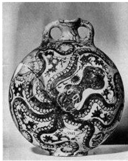
Slika 3: Morska stvorenja su vrlo često bila motiv za dizajniranje minojske keramike. Ova hobotnica odličan je primjer stila kretskih umjetnika, tzv. „morskog stila“.

Dedalu je kao svjedoku Minos zabranio odlazak sa Krete , ali Dedal je zajedno sa svojim sinom Ikarom odlučio pobjeći preko neba, jer je kretska mornarica dobro čuvala sve izlaze s Krete . Načinili su krila od ptičjih pera i voska i krenuli prema Ateni , ali mladi Ikar previsoko je odletio, pa mu je sunce istopilo vosak, nakon čega je uslijedio pad, a Dedalu je ostao bol u duši zbog gubitka sina. Sam Dedal otišao je na Siciliju , gdje je po njega došao Minos, ali je Dedal kao poznati graditelj u dosluhu sa tamošnjim kraljem izgradio tajni vodovod kojim je na Minosa pustio vrelu vodu dok se ovaj tuširao nakon dugog puta s Krete . Najzahvalniji su mu bili Atenjani koji su dopustili Dedalu povratak u Atenu iz koje je davno istjeran zbog ubojstva svog nećaka Tolosa , na kojeg je bio ljubomoran jer je postao gotovo jednako dobar graditelj kao Dedal .