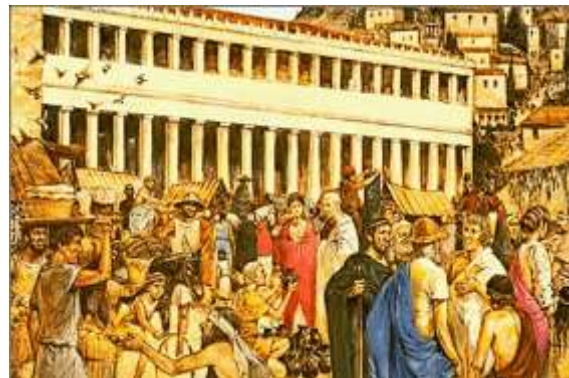
Slika 8: Prikaz atenske agore ili tržnice, a takvo mjesto bilo je centralno mjesto u svakom grčkom polisu. Za razliku od većine dotadašnjih gradova na Istoku, grčki polisi nisu izrastali zbog potreba trgovine u blizini rijeke ili mora, nego naprotiv što dublje u unutrašnjosti radi sigurnosti od pomorskih napada. Trgovina u grčkim polisima postaje posljedica, a ne razlog nastajanja gradova, jer glavnu ulogu u polisima dobiva agora ili tržnica (na današnjem grčkom jeziku agorazo znači kupujem), koja postaje i centar društvenog i intelektualnog života grčkog polisa.