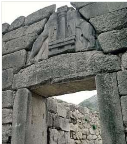
Slika 6: Lavlja vrata na ulazu u Mikenu uokvirena debelim i masivnim zidinama, koja na dobar način pokazuju zašto je postojalo uvjerenje da su mikenske zidine gradili kiklopi.

Grčka vojska opsjedala je Troju 10 godina, ali nisu mogli osvojiti dobro utvrđeni grad. Rat je pošao po zlu za Grke nakon što je Ahil poslije svađe s Agamemnonom napustio bojište, a Trojanci su predvođeni svojim junakom Hektorom gotovo potjerali Grke na njihove brodove. Ahil se vratio u bitku nakon što je Hektor usmrtio njegovog najboljeg prijatelja, Patrokla , a Ahil je ubrzo osvetio Patroklovu smrt. Ilijada koja opisuje ova događanja u desetoj, posljednjoj godini opsade Troje završava Hektorovim pogrebom, a mnoge grčke legende opisuju slijedeće događaje.