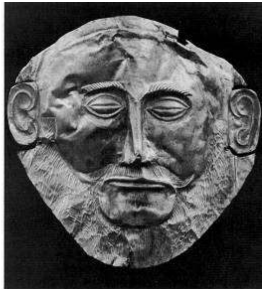
Slika 5: Posmrtna zlatna maska, koju je Schliemann pripisao Agamemnonu, pa se do danas za nju uvriježio naziv Agamemnonova zlatna maska .

Mikenu je kao i Troju, otkrio njemački trgovac i arheolog-amater, Heinrich Schliemann , nadahnut sadržajem i ljepotom, te uvjeren u vjerodostojnost Homerove Ilijade i Odiseje . Arheološke iskopine ne govore nam puno o političkoj i društvenoj povijesti Mikene, ali nam pokazuju veliko bogatstvo, a uz to vjerojatno i veliku moć Mikene za spomenuto razdoblje. Unutar zidina Mikene otkrivene su grobnice mikenskih vladara sa nevjerojatno raskošnim sadržajem: zlatne krune, dijademe, zlatni reljefi s ratnim i lovačkim prizorima, posmrtno zlatne maske, a najljepšu od njih Schliemann je pripisao Agamemnonu – legendarnom kralju koji je prema Homeru vodio pohod Ahejaca na Troju. Mikenske grobnice bile su nadstvođene sa lučnim nadvratnikom iznad ulaza u grobnicu kružnog tlocrta, i poznate su pod nazivom tholos. Najpoznatiji i najbolje sačuvani tholos nalazi se