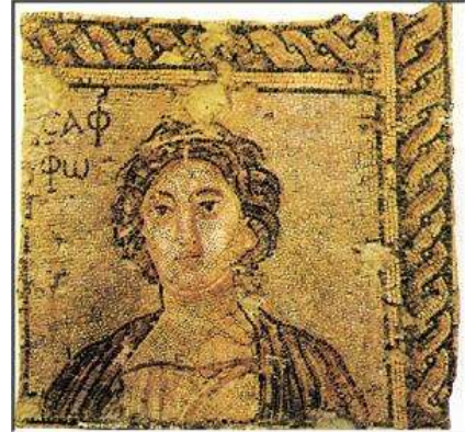
Slika 7: Slika navodno prikazuje pjesnikinju Sapfo s otoka Lesbosa, po kojem će cijeli ženski homoseksualni pokret ponijeti naziv. Ona je jednostavno bila udovica u malom mediteranskom mjestu, pa možete pretpostaviti kakve bi priče o njoj kružile da se družila s muškarcima. Zato se družila s prijateljicama, prema kojima je ponekad znala biti i ljubomorna, što je ostalo zabilježeno u njenim pjesmama, jer joj nisu posvećivale dovoljno pažnje, naime, one su ipak bile slobodne, pa su se mogle družiti sa seoskim momcima, a Sapfo bi ostajala usamljena. Tako je jadna Sapfo ispala lezbijka, niti kriva niti dužna.

što se podrazumijeva pod polisom bilo je građeno u dva nivoa. Na vrhu kakvog uzvišenja (po mogućnosti s izvorom pitke vode) stajala je akropola (uzvišeni grad), na kojem je bio centralni