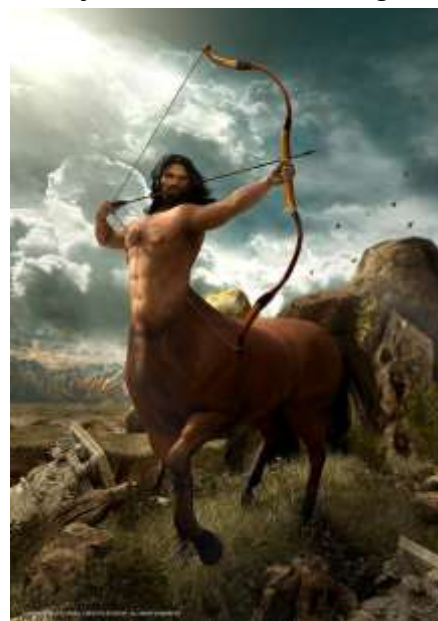
Slika 7: Kentaur – mitološko biće, koje je pola konj, a pola čovjek. Snaga i silina Dorana proizlazila je iz njihovog korištenja konja i proizvodnje oružja od željeza, a ne od bronce, čime su naravno bili puno ubojitiji od ostalih grčkih plemena. Mnogi povjesničari su uvjerenja da je doranska konjica pokrenula mit o Kentaurima, jer Grci do tada nisu vidjeli konje.

Svijetlo u mraku donosila je činjenica da tehničke vještine ipak nisu zaboravljene, tj. keramika se i dalje izrađuje, ali u puno jednostavnijem tzv. geometrijskom stilu . Grčki jezik se očuvao (iako samo govorni) u onim krajevima koje nije snažnije dotakla dorska invazija.