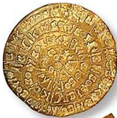
Slika 4: Disk iz Festosa , na kojem je prikazan najstariji oblik pisma na Kreti .

Dobar geografski položaj Krete uvjetovao je izgradnju jake mornarice i bavljenje trgovinom , u kojoj je dominirala sjajna kretska keramika po kojoj je minojska kultura bila unikatna, a posebno su bile poznate i cijenjene keramičke posude oslikane morskim temama ,