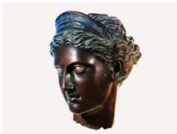
Slika 10: Glava božice Artemide. Uz Lošinjskog Apoksiomena, Artemida je jedan od najvažnijih antičkih nalaza u Hrvatskoj. Čuva se u trezoru banke u Visu

i lukom na istočnoj obali Jadrana, i uskoro utemeljio koloniju Issa (Vis). Vrlo brzo će Grci s otoka Korkira (Krf) osnovati Korkyru Melainu (Crna Korkira, na Korčuli, zbog guste crnogorične šume), a kolonisti s otoka Pharosa u Egejskom moru osnovat će Pharos (Stari Grad na Hvaru). Zbog trgovine s domaćim stanovništvom na obali, Grci sa Issa osnovat će svoje trgovačke faktorijske na obali – Tragurij (Trogir) i Epetij (Stobreč, kraj Splita).