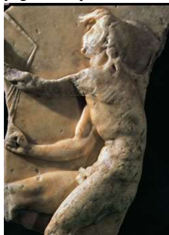
Slika 11: Kairos , božanstvo sretnog trenutka.

Vrhunac grčke kolonizacije naše obale dostignut je tijekom IV st.B.C. Sirakuški tiranin (Sirakuza na Siciliji) Dionizije Stariji pokušao je ostvariti što čvršću kontrolu trgovine na Jadranu, pa je u tu svrhu osnovao Ankon (današnja Ancona u Italiji), ali s tim prostorom nije bio zadovoljan jer talijanska obala nije pogodna za plovidbu kao naša strana. Zato je Dionizije krenuo u potragu za dobrim uporištem