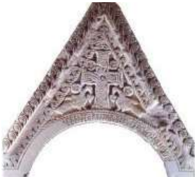
Slika 2: Zabat s oltarne pregrade iz predromaničke crkve Sv. Luke u Uzdoľju kod Knina, s natpisom kneza Mutimira i godinom 895.

Najmlađi Trpimirov sin koji je stolovao u Bijaćima kod Trogira . Prvi vladarski problem koji je morao riješiti bio je spor između ninskog biskupa i splitskog nadbiskupa oko vlasništva crkve Sv. Jurja u Putalju . Naime, nakon malog crkvenog raskola (863.g.) splitski nadbiskup pristao je uz carigradskog patrijarha, a ninski biskup ostao je vjeran papi, i oduzeo