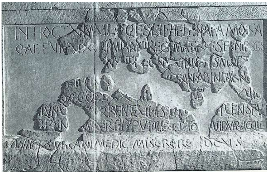
Slika 4: Sarkofag kraljice Jelene. Ovaj nadgrobni natpis pronađen je polomljen u oko 90 komada i oštećen u požaru. Na natpisu je zapisana godina Jelenine smrti i podaci da je ona bila žena kralja Mihajla Krešimira II i majka Stjepana Držislava, što je omogućilo rješavanje genealogije hrvatskih vladara, te je u tome velika važnost ovog natpisa.

Ostavština kraljice Jelene važan je izvor za hrvatsku povijest ranog srednjeg vijeka, naime ona je dala sagraditi crkvu Sv. Marije ( Gospa od Otoka u Otoku kod Solina) u kojoj je ostala sačuvana njena nadgrobna ploča koja je važan izvor za genealogiju hrvatskih narodnih vladara .