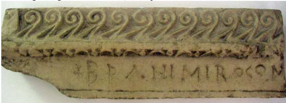
Slika 1: Branimirov natpis iz Šopota kod Benkovca. Slika prikazuje gredu koja je pripadala oltarnoj pregradi, s uklesanim Branimirovim imenom. Natpis ima veliku važnost jer je to prvi kameni natpis na kojem je uz ime kneza upisano i da je bio knez Hrvata (dux Croatorum) , što je rijedak slučaj i u europskim razmjerima.

Papa Ivan VIII u svom pismu obavještava Branimira da mu priznaje "zemaljsku vlast" ( principatus terrenum ) i da je u crkvi Sv. Petra u Rimu blagoslovio Branimira ,