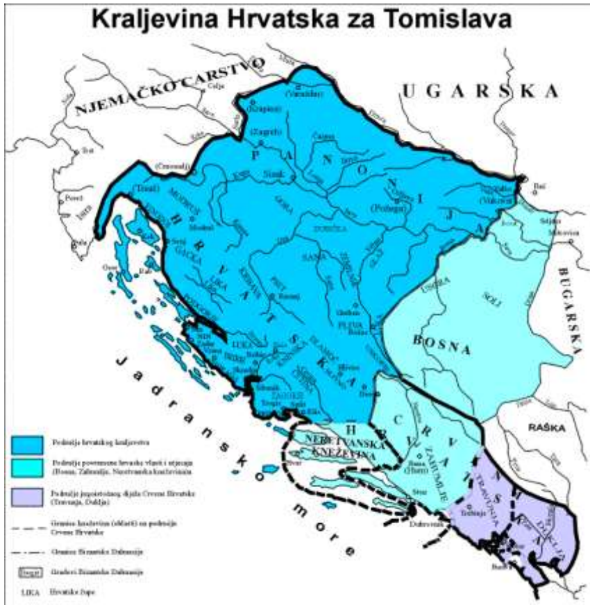
Slika 3: Na karti Tomislavova vladanja dobro se vidi kontrola gradova Bizantske Dalmacije, dok u kontinentalnom zaleđu uspješno odbija pritiske Ugara i Bugara, pa se prostor Tomislavova kraljevstva širi sve do Panonije.

Prema zapisima cara Konstantina Porfirogeneta, Tomislav je na vrhuncu moći mogao podići vojsku od 100 000 pješaka, 60 000 konjanika, te opremiti 80 velikih i 100 malih lađa (vjerojatno pretjeruje), pa je moguće da se zbog te svoje snage sam proglasio za kralja, jer nikakav dokaz o krunjenju Tomislava ne postoji (osim narodne predaje o krunjenju na Duvanjskom polju). Jedini pisani dokaz koji spominje Tomislava kao kralja je pismo pape Ivana X (koje je sačuvano u rukopisu Historie Salonitane Maior, Tome Arhiđakona) u kojem između ostalog piše: "...Joannes episcopus servus servorum Dei dilecto filio Tomislao