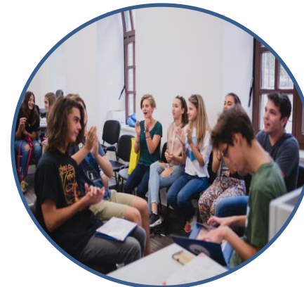
zanimljive radionice i interaktivna predavanja