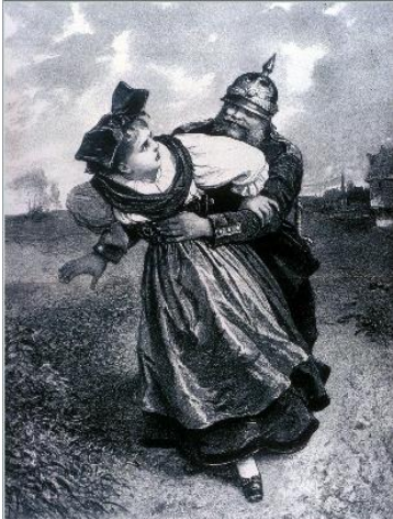
Slika 4: Propagandni plakat nastao nakon pruske aneksije pokrajine Alsace i Lorraine . Mlada Francuskinja koja simbolizira okupiranu regiju napastovana je od strane pruskog vojnika. Naslov plakata glasi: "Možeš me uzeti, ali nikada neću biti tvoja!"

na strani Austrije, ali je bio dovoljno mudar da ne anektira austrijske teritorije, što je bila želja kralja i vojnog vodstva, jer se ipak nadao dobrim odnosima s Austrijom u budućnosti.