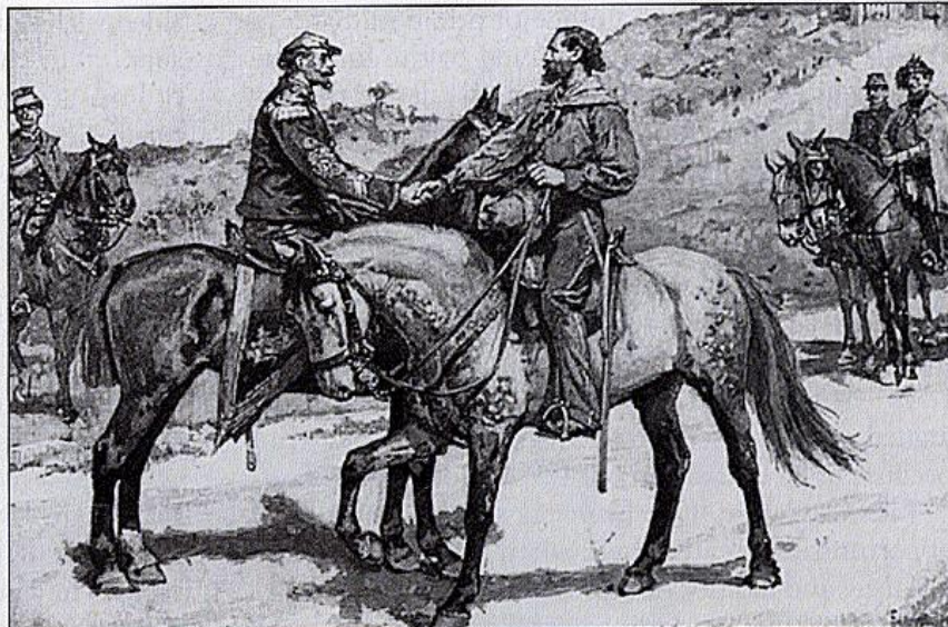
Slika 4: Susret kralja, obučenog u službenu vojnu odoru, i Garibaldija, potpuno neformalno obučenog, s prepoznatljivom maramom oko vrata. Umjetnik je naglasio značaj trenutka i prikazao je Garibaldija kao ponosnog domoljuba, ali koji je ipak skinuo kapu pred svojim kraljem, a isto tako i Garibaldijev konj zauzima pozu poniznosti. Kralj Vittorio Emanuell pokazao je svoje dostojanstvo ravnopravno se rukujući s Garibaldijem. Ovakvim nastupom izbjegnuto je mogući građanski rat u Italiji.

popularnost do nebeskih razina. Takva popularnost izazivala je dozu straha kod Cavoura, koji se bojao da bi Garibaldijev napad na Rim mogao potaknuti Francusku, pa čak i Austriju da priskoče u pomoć papi. Zato je Cavour poslao svoje trupe, a krenuo je i sam kralj Vittorio Emanuell II, da zaustave Garibaldija. Dvije vojske susrele su se južno od Rima i činilo se da je sukob neizbježan, ali dogodila se – za talijansku budućnost – sjajna stvar, naime Garibaldi i kralj Vittorio Emanuell pružili su jedan drugome ruku , što je osiguralo jedinstvo Italije. Galantni rodoljub uskoro se povukao u osamu na mali otok Capreru, ali je i dalje davao podršku svim nastojanjima za priključenje ostalih talijanskih teritorija, a posebno Rima, ujedinjenoj Italiji.