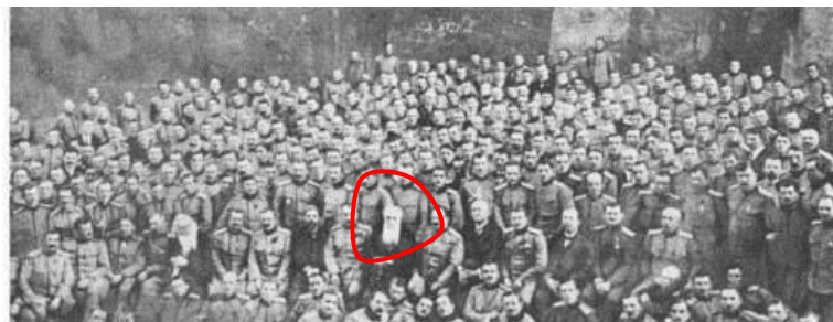
Slika 4: Predsjednik srbijanske vlade Nikola Pašić s časnicima dobrovoljačkog korpusa Slovenaca Hrvata i Srba 1916. u crnomorskoj luci Odesa. Korpus je bio sastavljen od zarobljenih austrougarskih vojnika južnoslavenskog podrijetla, pretežno Hrvata. Hrvatski pripadnici korpusa pobunili su se protiv svojih srpskih časnika što je bila zlokobna najava prilika u budućoj južnoslavenskoj državi.

Dogovorom Jugoslavenskog odbora te srbijanske i ruske vlade, od tih je zarobljenika trebalo oformiti dobrovoljačku Jadransku legiju , koja bi ratovala u službi Antante. Svi koji su na to pristali okupili su se u crnomorskoj luci Odesi 1917.g. Pod utjecajem srbijanske vlade i zarobljenih Srba, ta postrojba nazvana je Prva srpska dobrovoljačka divizija , a njezini su pripadnici nosili